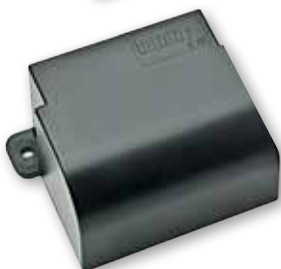
Lommy Eye 15 års model IP68 - Vandtæt Dimension: 80x54x37 mm