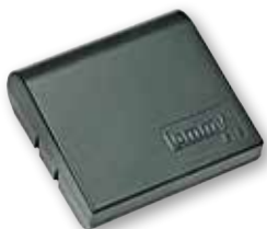
Lommy Eye 3 års model IP 33 Dimension: 55x52x21 mm

VARM ELLER KOLD. Er varmen tændt i båden? Hvad er temperaturen i sommerhuset? Hvor befinder enheden sig – på et varmt loft eller i en kold kælder? Temperaturen giver svaret.